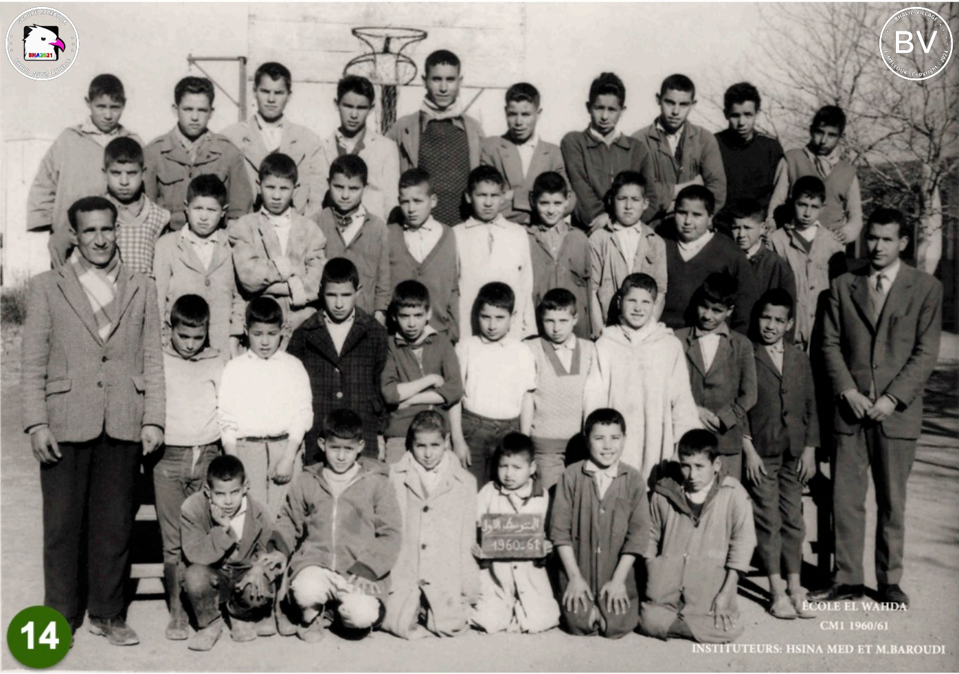
ÉCOLE EL WAHDA CMI 1960/61